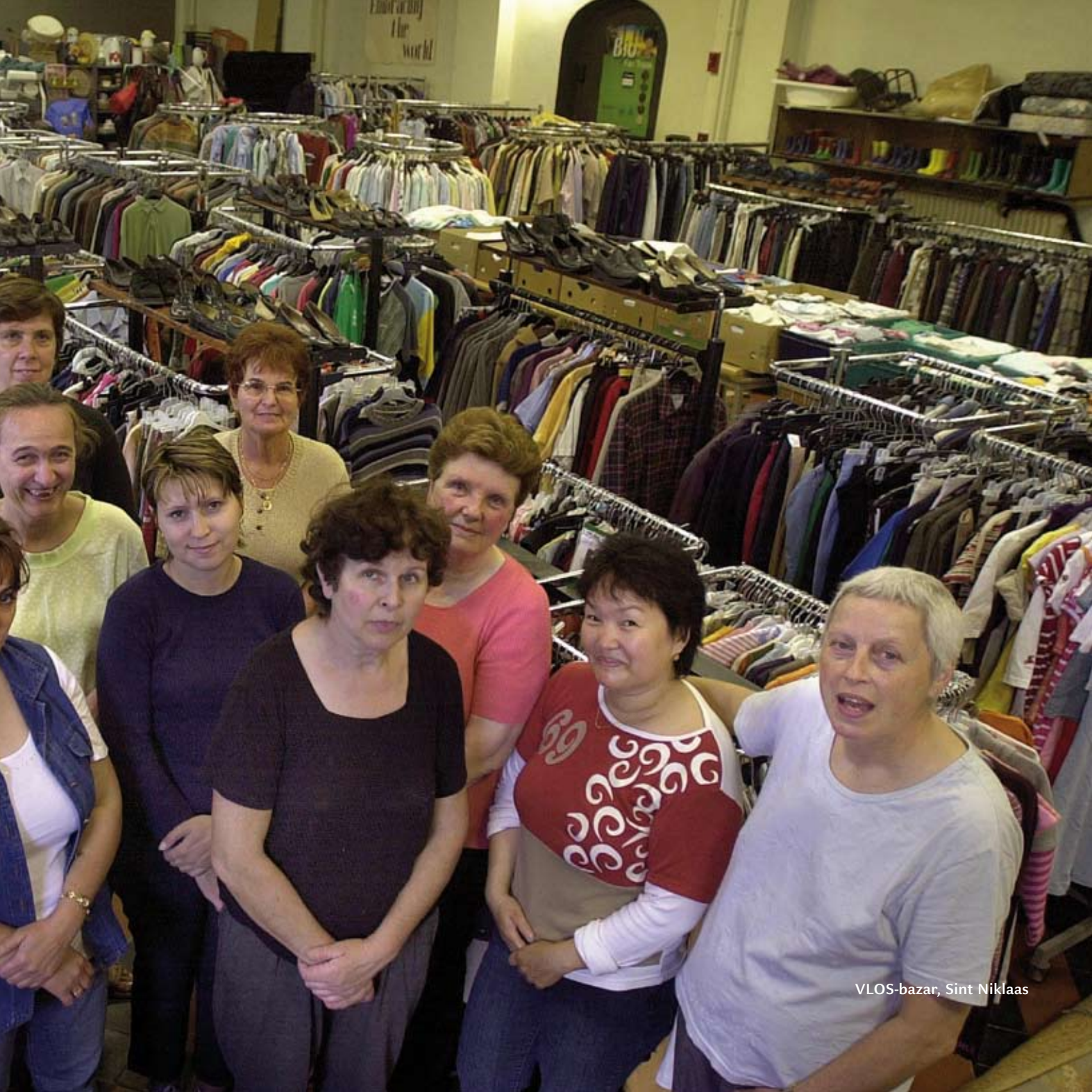
VLOS-bazar, Sint Niklaas