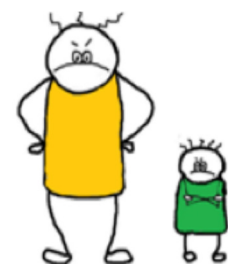
individuele fase SEO-R 2

Elke persoon heeft drie leeftijden: fysiek, intellectueel en emotioneel. Indien deze drie niet in harmonie zijn, kan dit zich uiten in moeilijk te begrijpen gedrag. Het is dan ook een uitdaging om door beeldvorming een beter zicht te krijgen op de mogelijkheden en onmogelijkheden van elk individu waar we mee werken. De SEO-R 2 is een instrument dat hierbij handvaten biedt. Op de vrouwenafdeling, bij de geïnterneerden hebben we in 2016 een traject gelopen met het bewakingspersoneel, het zorgteam en de PSD. Na een korte introductie, werden onder begeleiding van coach Lore (met dank aan SEN vzw) twee SEO's ingevuld. In het najaar konden enkele medewerkers van de PSD de