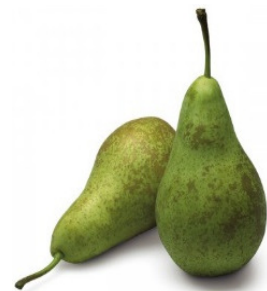
eerste fruit van de maand: peren

Om gedetineerden aan te moedigen gezonder te eten, wordt er elke maand via het intern tv-kanaal een andere fruitsoort aan een verminderde prijs aangeboden. In een korte presentatie worden de gezondheidsvoordelen van het 'fruit van de maand' benadrukt en worden suggesties gedaan hoe het fruit te serveren of te bereiden. Uitgangspunt is dat het artikel kan bereid en gegeten worden op cel. De microgolfoven werd in 2016 als standaarduitrusting op cel voorzien, wat de mogelijkheden om maaltijden te gaan bereiden vergroot. Dit is een samenwerking tussen de werkgroep gezondheid (doelstelling actieplan 2016-2018), de boekhouding en de vaste leverancier van fruit en groenten.