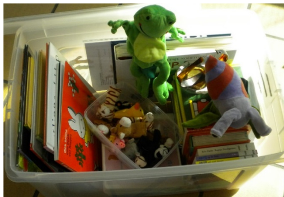
De koffer met voorleesboeken en vertelpoppen

voorleesmoment te organiseren voor de kindjes en mama's van de moeder-kind: verschillende soorten boekjes, vertelpoppen & dekentjes. Zo willen we de moeders aanmoedigen om zelf meer voor te lezen aan hun kind, om de taalontwikkeling van het kind te stimuleren.